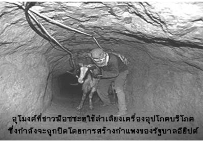
มูโงคฺที่ชาวฉ้อชชะฮูใช้ลำเลียงเครื่องอุปโภคบริโภค ซึ่งกำลังจะถูกปิดโดยการสร้างกำแพงของรัฐบาลอียิปต์